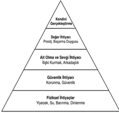
Şekil 1: Maslow'un İhtiyaçlar Hiyerarşisi Piramidi (Koca Gülbay, 2018)