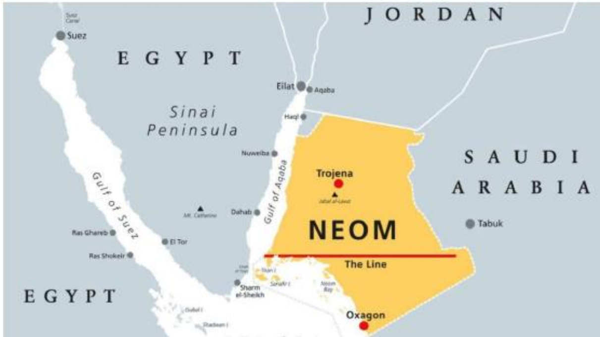
Şekil 4: NEOM ve Alt Projelerinin Suudi Arabistan ve Çevre Ülkelere Göre Konumu