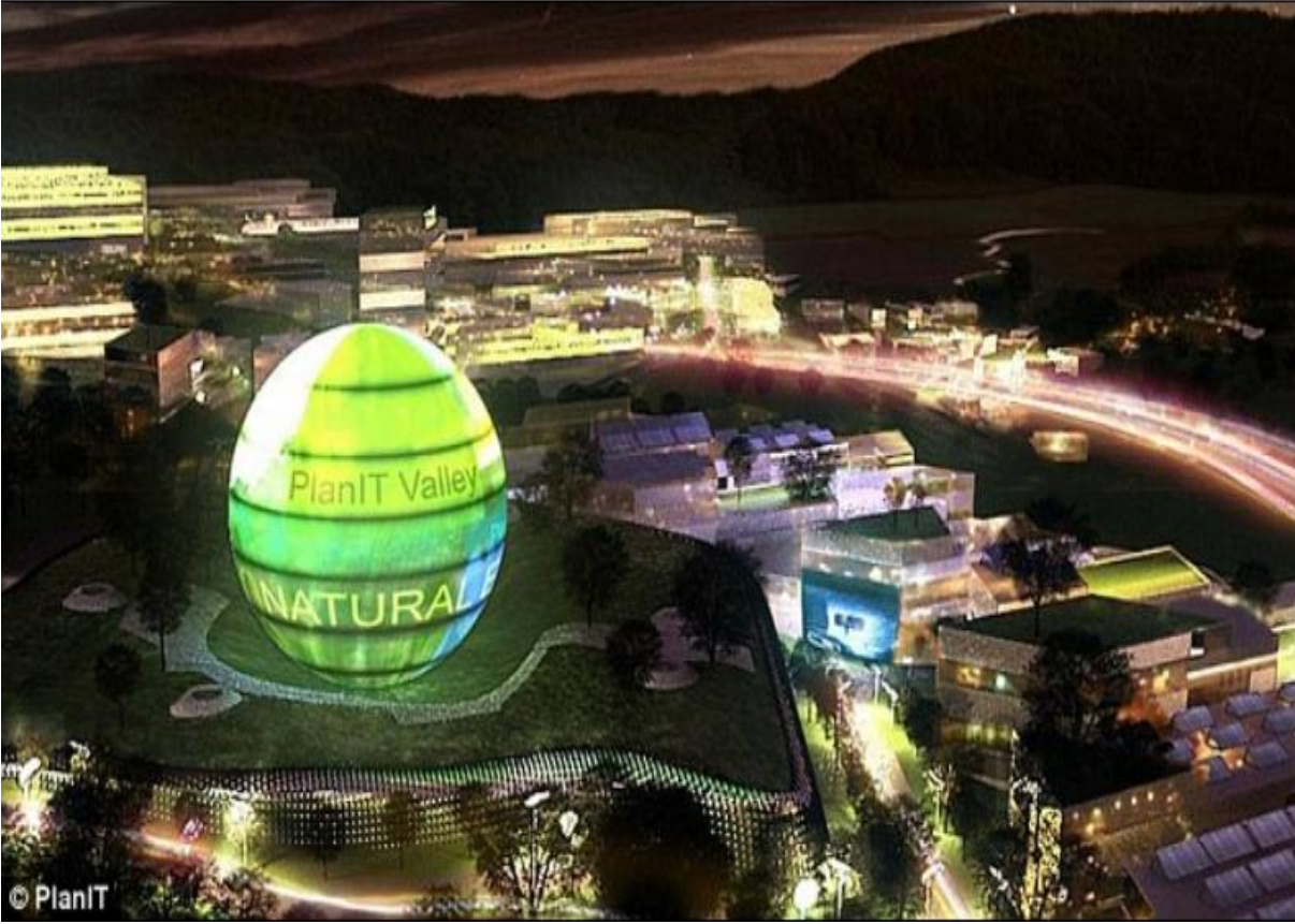
Şekil 1: Plan IT Vadisi Projesi