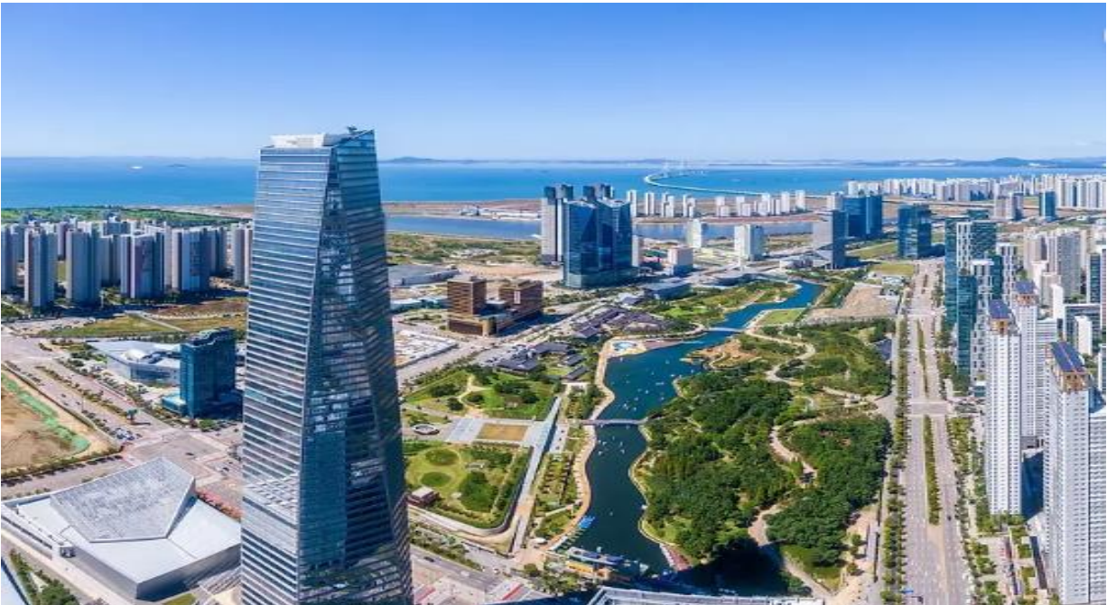
Şekil 2.: Yeni Songdo Kenti Projesi