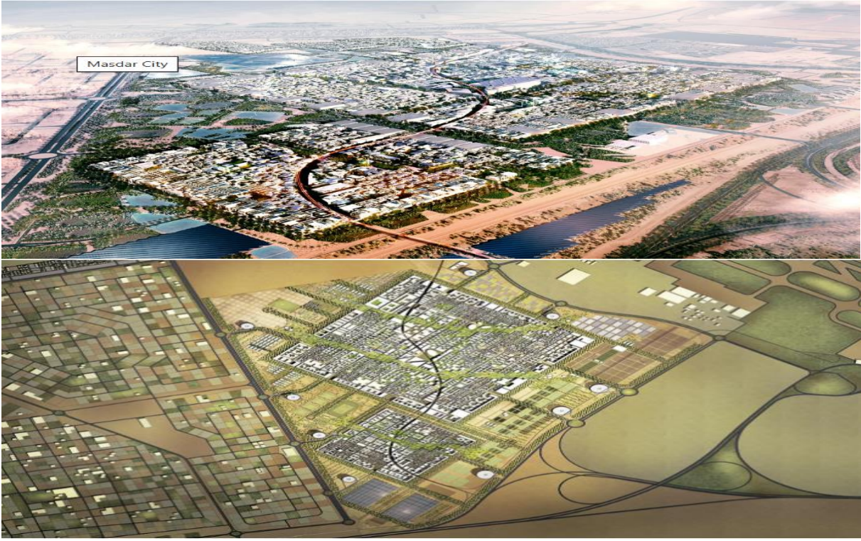
Şekil 3: Masdar Sürdürülebilir Kent Projesi